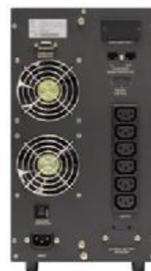
Rückseite MKD 2000